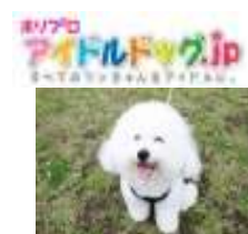
ホリプロアイドルドッグ.jp

<ワンコの笑顔フォトコンテスト URL> http://www.idoldog.jp/p/smile_contest