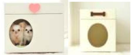
横置きタイプ ¥29,500(税込み) 縦置きタイプ ¥28,500(税込み)

<参考URL> http://wan-chan.jp/prom/araki-report-vol9/index.html