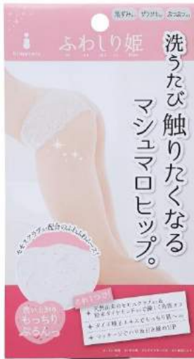
ふわしり姫商品パッケージ写真