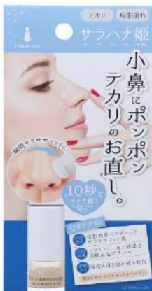
サラハナ姫商品パッケージ写真