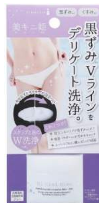
美キニ姫商品パッケージ写真

商品名：サラハナ姫 価格：¥1,250(税抜) 内容量：約1.8g 発売日：2018年4月13日(金) 販路：一部バラエティショップ、自社 EC サイト、EC モール 自社 EC サイト： https://fan.liberta.net/item/nonplex/himecoto/7671/