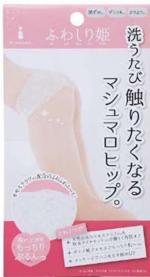
ふわしり姫商品パッケージ写真

■「ふわしり姫」EC サイト: https://fan.liberta.net/item/nonplex/himecoto/7683/