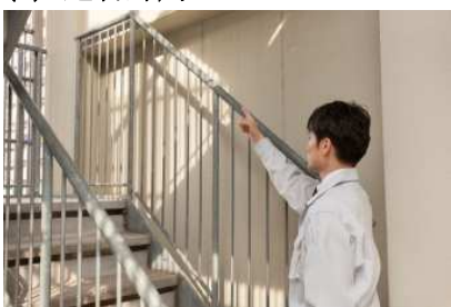
エントランスから対象住戸までの動線 上の躯体の状態などを目視でチェック