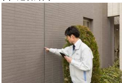
建物外周の躯体の状態などを 目視でチェック