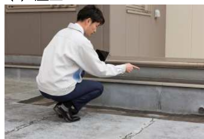
屋上の防水状況などを 目視でチェック *4