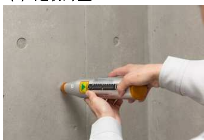
シュミットハンマーでコンクリート 圧縮強度をチェック *3