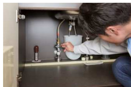
給排水管の水漏れなどを チェック（専有部）