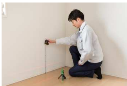
レーザーを使って室内の床の 傾きなどをチェック