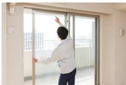
外壁・内壁の劣化状況 などをチェック