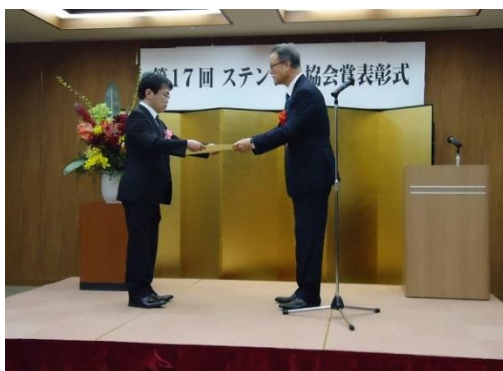
◀ 3月27日 第17回ステンレス協会賞表彰式を受賞風景（鉄鋼会館）