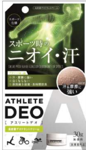
アスリートデオ 薬用デオドラントクリーム 商品パッケージ

商品名： アスリートデオ 薬用デオドラントクリーム 価格： 1,600円(税抜) 販路： ゼビオグループ、自社 EC サイト、EC モール 内容量： 30g