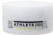
アスリートデオ 薬用デオドラントクリーム容器