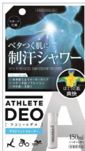
アスリートデオ 薬用デオドラントウォーター 商品パッケージ