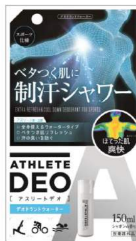
アスリートデオ 薬用デオドラントウォーター 商品パッケージ