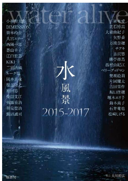
『水風景 VOL,3 2015-2017』表紙