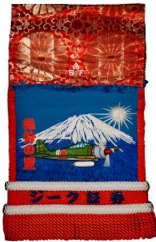
化粧まわし(稀勢の里)