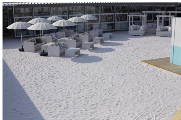
WILD BEACH 仙台(ビーチ)