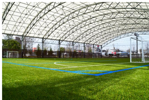
MIFA Football Park 仙台(全天候型フットサルコート)