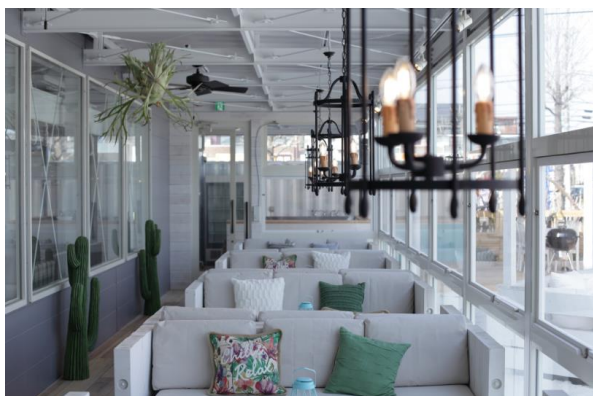
WILD BEACH 仙台(ルームテラス)

東京都新宿、千葉県木更津で、「もっと自由に、優雅に、スタイリッシュに」をコンセプトにアウトドア施設を展開する RECREATIONS 株式会社が、子供たちから若い世代を中心に大好評の「白いビーチ」と「カフェ、バーベキュー、グランピング」の複合施設「WILD BEACH(ワイルドビーチ) 仙台」を東北エリアに初出店いたしました。