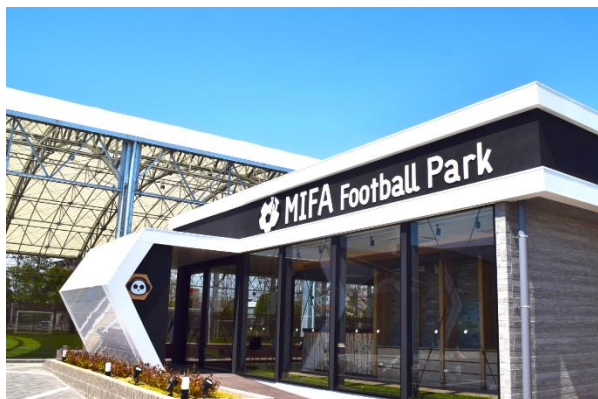
MIFA Football Park 仙台(クラブハウス外観)

MIFA とは「Music Interact Football for All」の意味で、Mr.Children 桜井和寿と GAKU-MC のユニット「ウカスカジー」が所属し、音楽とフットボールを通じて様々なコミュニケーションを創造していくことを目的とした団体です。「MIFA Football Park 仙台」は、音楽とフットボールを通して“東北エリアの心と笑顔が通い合う場所”を目指しています。