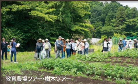
教育農場ツアー・樹木ツアー