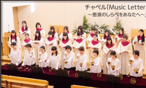
チャペル「Music Letter ～恵泉のしらべをあなたへ～」