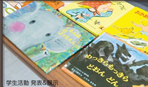
学生活動 発表&展示