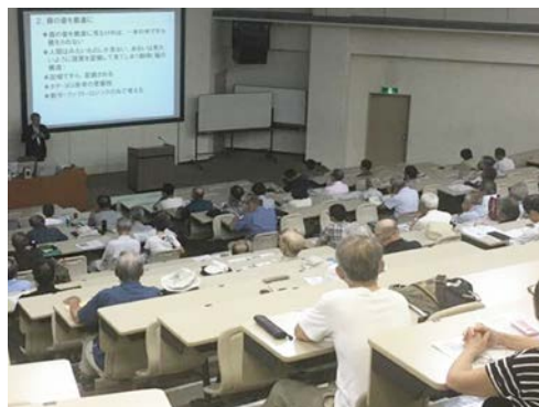
公開教養講座 2017 の様子