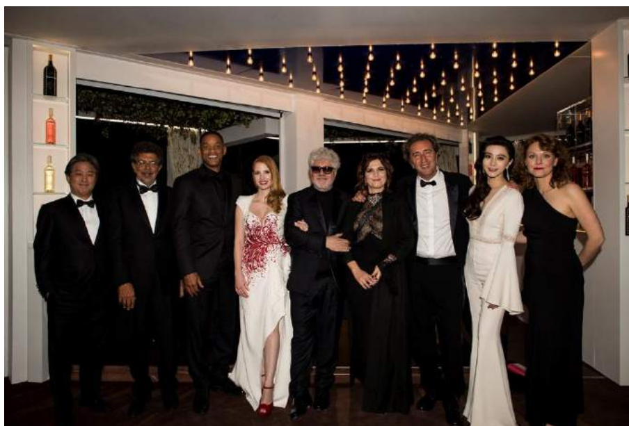
授賞式後、最後の夜を楽しむ 2017年カンヌ国際映画祭の審査員たち