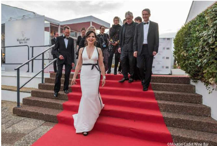
ジュリエット・ビノシュ 2017 年アンジェニュー撮影賞の審査員メンバー