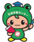
生涯学習センターマスコット「KELL (ケル)くん」

政府は平成29年に「人生100年時代」という新たなキーワードを発表し「いくつになっても学び直しができ、新しいことにチャレンジできる社会」の実現に向けた施策構想に着手しました。敬愛大学のある千葉市においても「超長寿時代を見据えた、豊かな持続可能な地域社会」を大学と市の連携により進めていく方針です。