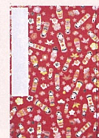
和綴じノート 見本

【日時】 6/2(土)、6/7(木) 13:00~15:00 【参加方法】 13:00に企画展受付にお越しください 【定員】 各日20名(希望者多数の場合は抽選) 【内容】 明治時代の教科書にも用いられた「和綴じ」の製本方法でノートを作ります