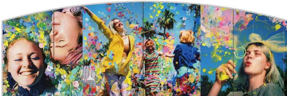
<ウィンドウディスプレイ展開イメージ>

写真とペイントにより、テーマのキーワードとなる「フェス」を、「人や自然と溶け合う」、「生の感情をさらけ出す」空間として表現します。被写体となるモデルたちの、無防備でありのままの感情や動きにフォーカスした写真の数々をご覧ください。