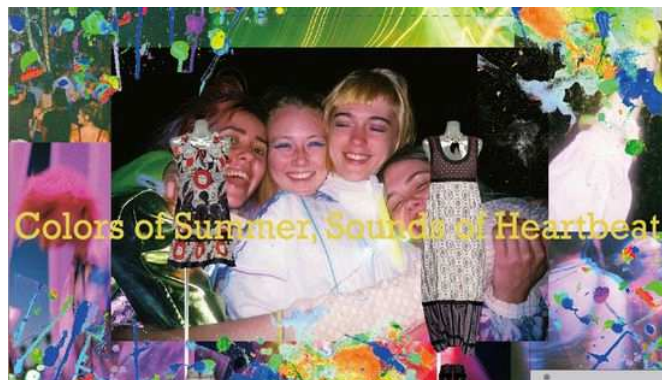
<ショーウィンドウアート完成イメージ>