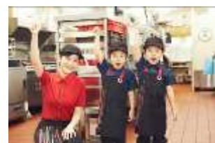
ユニフォームに着替える