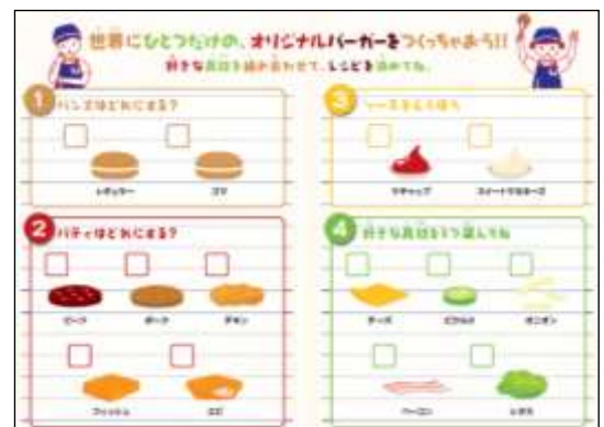
【スペシャルバーガープランのレシピノート】

体験プランは、「スタンダードプラン(600円/税込)」と「スペシャルバーガープラン(700円/税込)」をご用意しております。「スタンダードプラン」は、ハンバーガー作りができます。「スペシャルバーガープラン」は、世界でひとつだけのスペシャルバーガー作りができます。2種類のパンズ、5種類のパティ、2種類のソースからそれぞれ1種類、具材は5種類から3種類を自由に選べ、200通りのバーガーを作ることができます。