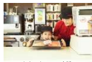
カウンターでの実践