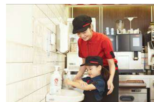
マクドナルドの手洗い