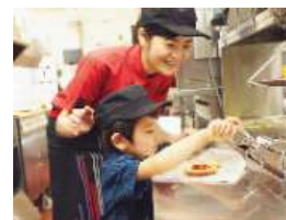
バーガー作りに挑戦