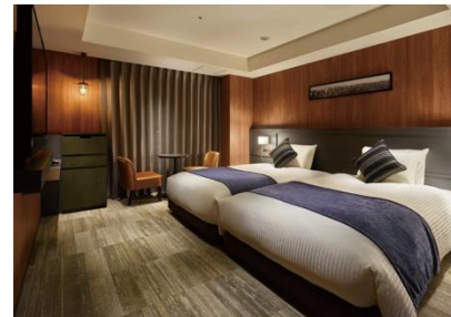
客室（スーペリアツイン）