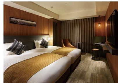
客室（コンフォートツイン）