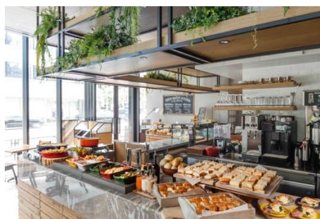
ベーカリーカフェ・レストラン「TOKYO BAKER'S KITCHEN」

朝食では、自家製パンを用いた世界各国のサンドイッチとこだわりのデリを中心としたブッフェをご用意。テイクアウト用の専用ボックスで、客室や外出先などお好きな場所、お好きなスタイルでの朝食もお楽しみいただけます。