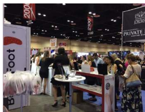
オランダで行われた展示会の様子②