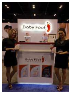
オランダで行われた展示会の様子①