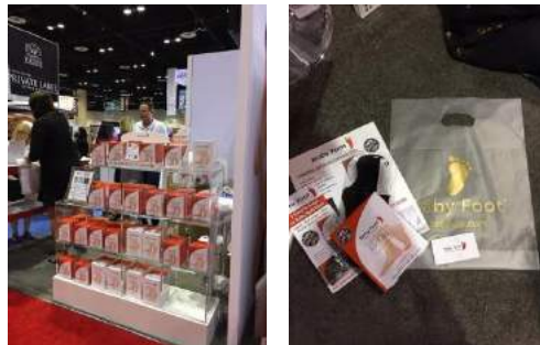
オーランドで行われた展示会の様子③

2018年6月2日から4日に開催された「Premier Orland」は、スパ、サロンが多く激戦区と言われるフロリダ州で全米最大級のサロン系流通の展示会になります。新規顧客開拓を主に目的とし、「Quality Customer」と呼ばれる質の良いお客様が多く、知識・人脈・ビジネス実績のある方が集まりました。販売もできる展示会で、ベビーフットシリーズ品(※1)は完売し、売上目標達成しました。また、購入者限定で、1日2名様に150ドル当たるプロモーションを行い、会場は盛り上がりを見せました。