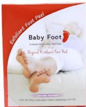
アメリカ版ベビーフット商品画像