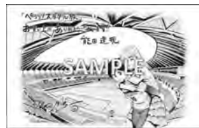
東京、愛媛、金沢、福岡、京都、山口、名古屋、千葉 各ご当地ペーパー