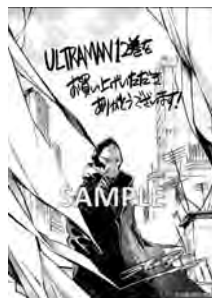
書店共通ペーパー