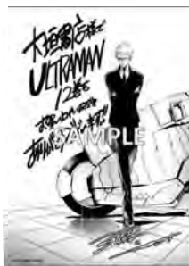
大垣書店 限定ペーパー