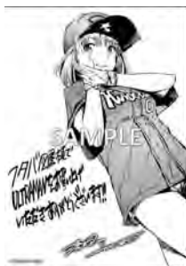
フタバ図書 限定ペーパー

『ULTRAMAN』第12巻の発売を記念して、一部書店でお買い上げいただいた方に、特典として描き下ろしペーパーを配布します。