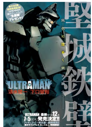
『ULTRAMAN』第78話 扉ページ ©清水栄一×下口智裕/ヒーローズ

また、同作者による『鉄のラインバレル 完全版』第8巻の同日発売を記念して、「生原画」プレゼント企画を開催。『ULTRAMAN』第12巻と『鉄のラインバレル 完全版』第8巻、それぞれの帯に付属している応募券2枚(各作品1枚)を一口にして、はがきに添付して応募すると、「サイン入り“生原画”」を抽選で4名の方にプレゼントします。詳しくは各コミックスの帯にてご確認ください。