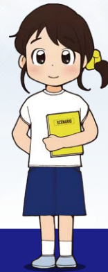
へんしゅう きろく 編集・記録