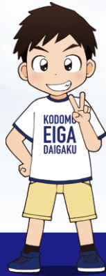
かんとく きやくほん 監督・脚本