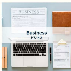
日経ビジネスオンライン President Online DIAMOND online Forbes JAPANなど