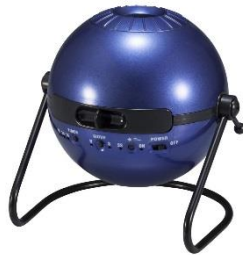
B賞:「夜空とつながる」 ホームプラネタリウム