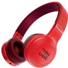
A賞:「スマホとつながる」ヘッドホン