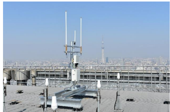
<日本橋にあるセンスウェイのゲートウェイ>