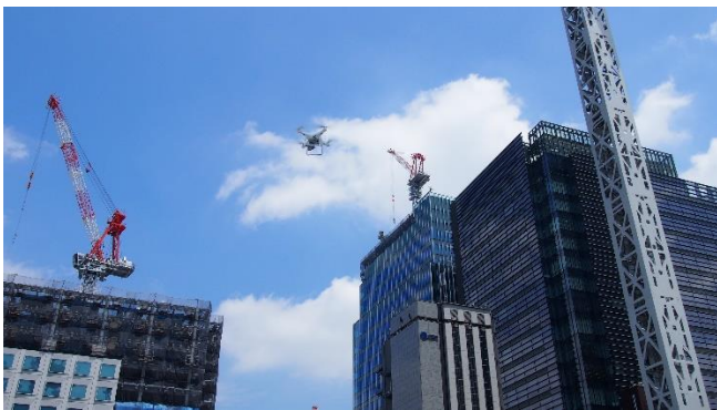
<日本橋での SiteAware 社との実証実験>

大企業が集積する日本橋では、新規事業創出を推進する「31VENTURES Clip ニホンバン」を開設、2017年には拡張移転いたしました。2階・3階には、超小型人工衛星を開発する株式会社アクセルスペースのオフィスが入居しています。また、製薬企業が多い日本橋の特徴を活かし、産業創造を強化するため、産官学でライフサイエンス・イノベーションを推進する「一般社団法人LINK-J」を立ち上げました。さらに、長距離・低消費電力のLPWAのLoRaWANを使ったIoTプラットフォームを提供するセンスウェイ株式会社とともにIoTの実証実験を行うなど、様々なベンチャー企業との共創を進めております。