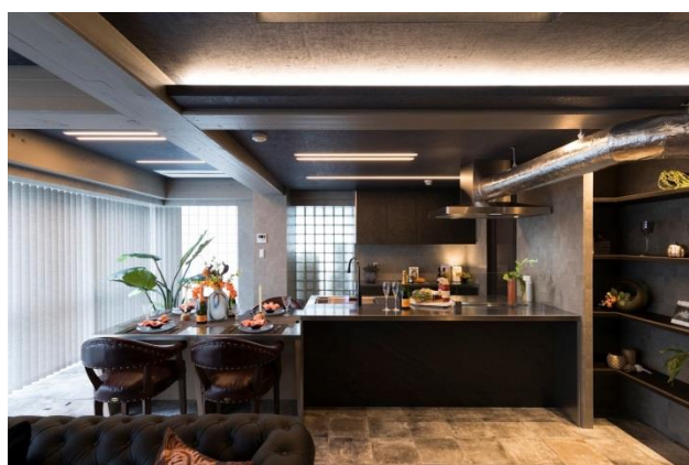
「リノエージェントサロン（原宿サロン）」の写真

大京グループでは、2016年10月に発表した中期経営計画「Make NEWVALUE 2021 ～不動産ソリューションによる新・価値創造～」において、リノベーション事業のシェアを拡大し、市場成長率を上回る水準で成長させることを掲げております。大京穴吹不動産では「Reno α（リノアルファ）」シリーズと一棟トータルリノベーションマンションブランド「グランディーノ」、一戸建て住宅リノベーション「リノテラス（Reno Terrace）」事業を通じ、ストック住宅の再生で持続可能な循環型社会の実現を目指してまいります。