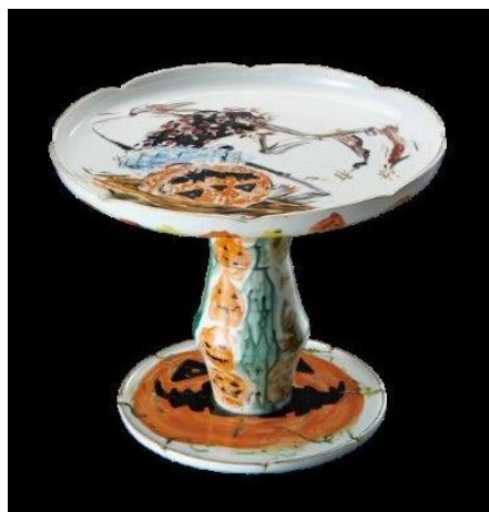
「ジャックの台皿」 (径 21.3×高さ 19.5cm)

また、物語の世界を体感できるギャラリーイベントやゲームも盛りだくさんで、おこさまにもお楽しみいただける内容の展覧会となっております。