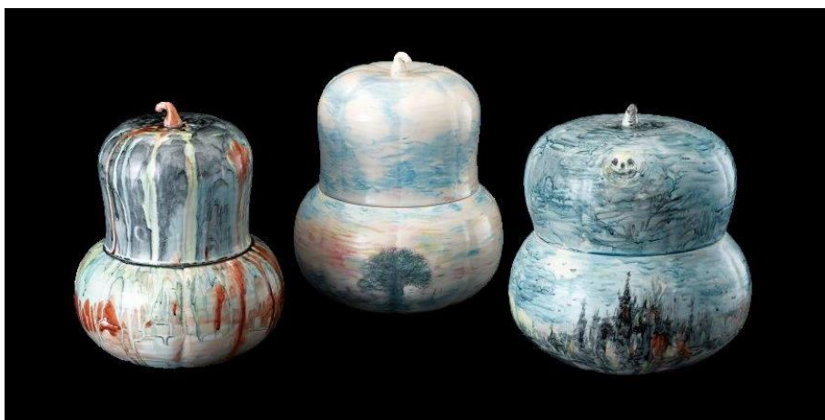
「パンプキン蓋物 朝」「パンプキン蓋物 昼」「パンプキン蓋物 夜」 (径 19.0×高さ 22.5cm) (径 20.4×高さ 25.5cm) (径 22.0×高さ 23.0cm)