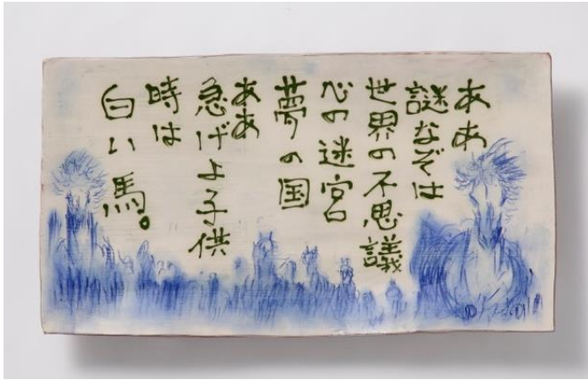
「白い馬 俎皿」 (50.5×29.0×高さ 7.0cm)