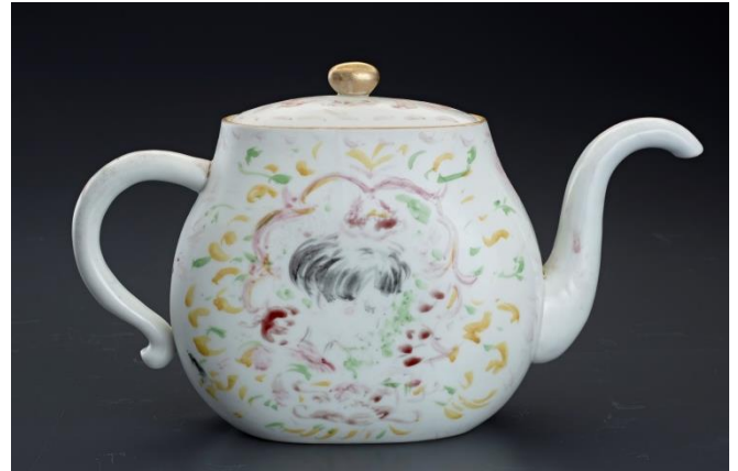
「チーマのポット」 (26.0×8.8×高さ 14.0cm)