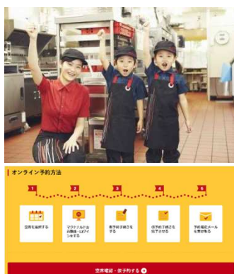
第2弾「マックアドベンチャー」のWEB予約開始