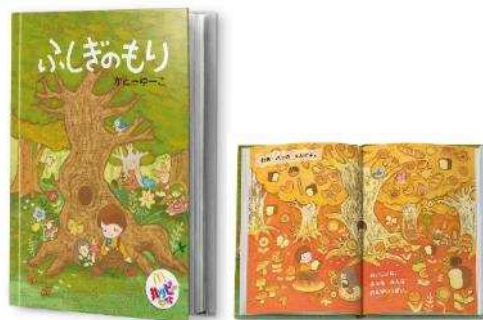
【絵本「ふしぎのもり」】