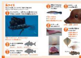
※図鑑の内容の一部