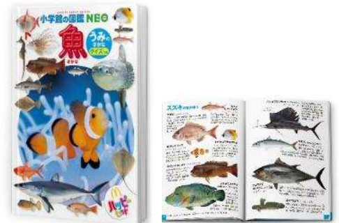
【ミニ図鑑「魚/うみのさかな」】

また、第3弾と同日にハッピーセット「スーパーマリオ」のおもちゃ全10種も期間限定で登場いたしますので、絵本・ミニ図鑑ともにおもちゃも選べる楽しさをご提供できればと存じます。なお、第4弾の絵本「ワニくんのながいかお」、ミニ図鑑「危険生物」は12月21日（金）に登場する予定です。