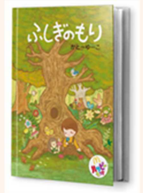
絵本「ふしぎのもり」