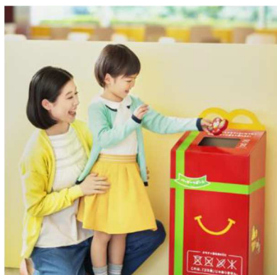
第1弾「おもちゃのリサイクルプログラム」実施

マクドナルドはグローバル全体で「お子様の健全な成長を願う様々な取り組み」を行っています。第1弾として「おもちゃのリサイクルプログラム」、第2弾として職業体験プログラム「マックアドベンチャー」のWEB予約システムを開始し、そして、第3弾として7月20日(金)よりハッピーセットがおもちゃに加えて絵本と図鑑も年間を通してお選びいただける「ほんのハッピーセット」がスタートしました。