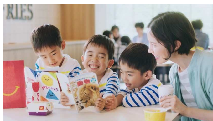
第3弾「ほんのハッピーセット」開始