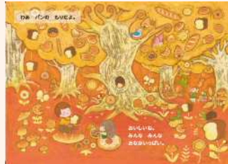
※絵本の内容の一部