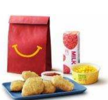
【ハッピーセット（イメージ）】

10月19日（金）から登場する第3弾は、絵本作家「かとうゆうこ」さんのオリジナル描き下ろし絵本で、優しさの連鎖を描いたあたたかい物語「ふしぎのもり」と、「小学館の図鑑 NEO 新版 魚 DVD つき」に載っている魚のうち、日本の海に住む代表的な海水魚47種を取り上げたミニ図鑑「魚/うみのさかな」です。