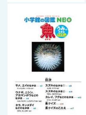
ミニ図鑑「魚/うみのさかな」