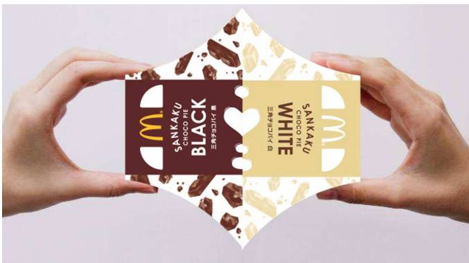
▲ 「三角チョコパイ 黒」と「三角チョコパイ 白」のパッケージを合わせる

「三角チョコパイ 黒」(左)、「三角チョコパイ 白」(右)のパッケージを組み合わせると、真ん中に♡のマークが現れます。