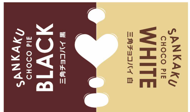
▲ 中央に、♡のマークが！