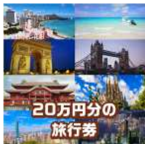
「20 万円分 旅行券」