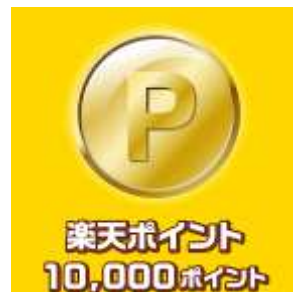
楽天ポイント 10,000ポイント