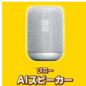
ソニー AIスピーカー