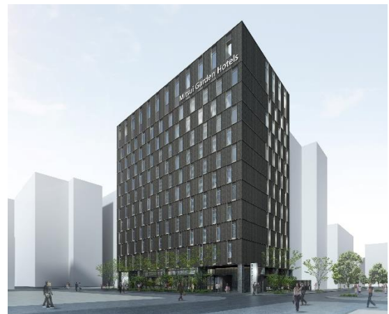
完成予想イメージ ※今後、変更となる場合がございます。

当施設は、三井不動産グループが運営するホテルとして、福岡市内では、現在建設を進めております「(仮称)博多駅前二丁目ホテル計画（2019年夏 開業予定・約300室）」に続いて2軒目、九州では「三井ガーデンホテル熊本（熊本市中央区・225室）」を含め、3軒目となります。