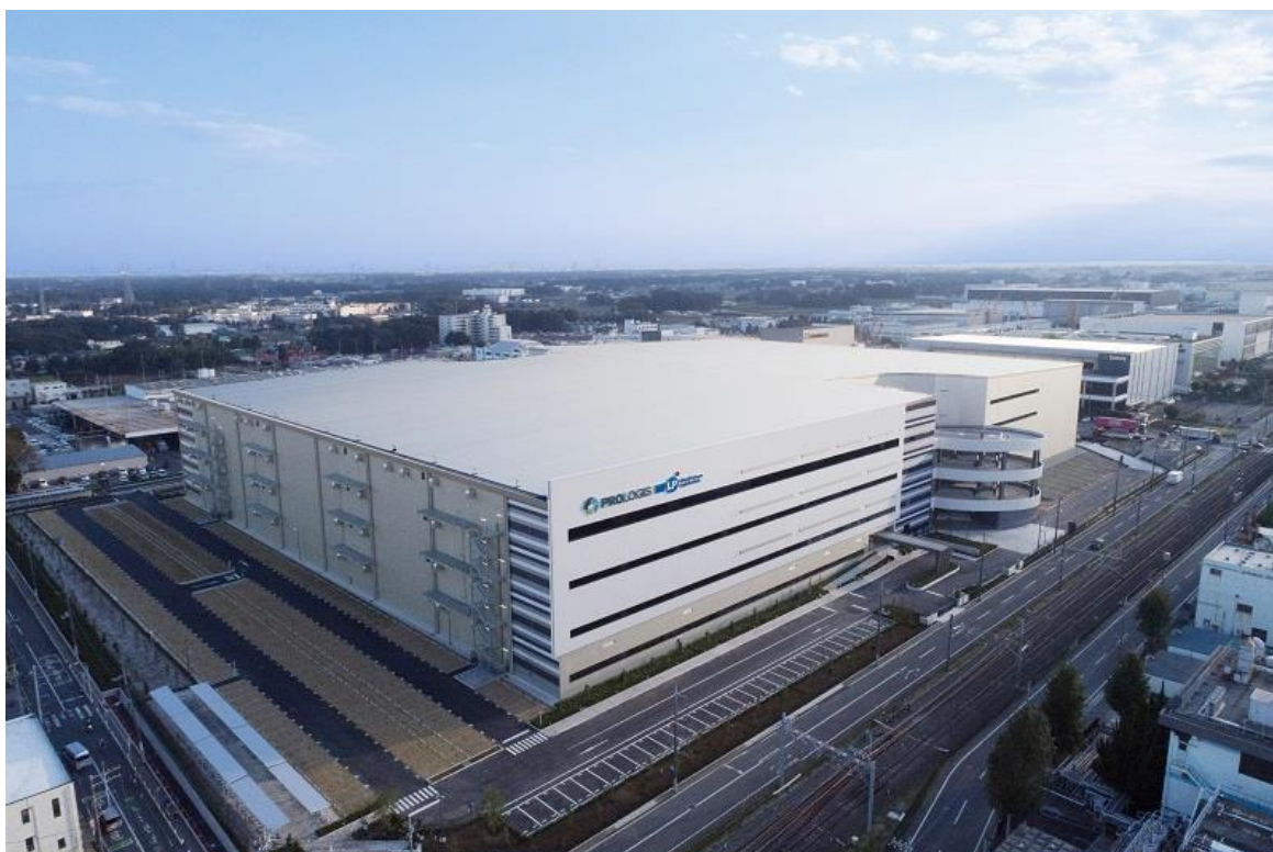
「MFLP プロロジスパーク川越」

三井不動産は、不動産業界国内最大手の総合デベロッパーとして2012年に物流事業に参画してから本施設を含む稼働施設が19棟、さらに14棟の開発・計画を進めている。一方プロロジスは、物流不動産のリーディング・グローバル企業であり、国内においては、これまでに93棟の物流施設を新規開発し(開発中を含む)、国内最多の物流施設の開発実績を持つ。このような双方の強みを活かし、共同事業の可能性を広げるべく、より先進的で質の高い物流施設「MFLP プロロジスパーク川越」がこのたび完成した。