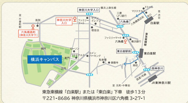
東急東横線「白楽駅」または「東白楽」下車 徒歩13分 〒221-8686 神奈川県横浜市神奈川区六角橋 3-27-1

この度開催されます「フランス週間」を通じて、フランスとわが国との経済・文化など多方面にわたる相互理解が深まることを祈念しております。最後になりますが、「フランス週間」の開催にあたりまして、在日フランス大使館、アンスティチュ・フランセ横浜など多くの関係機関、関係者に多大なご配慮をいただきましたことについて、ここに厚くお礼申し上げます。