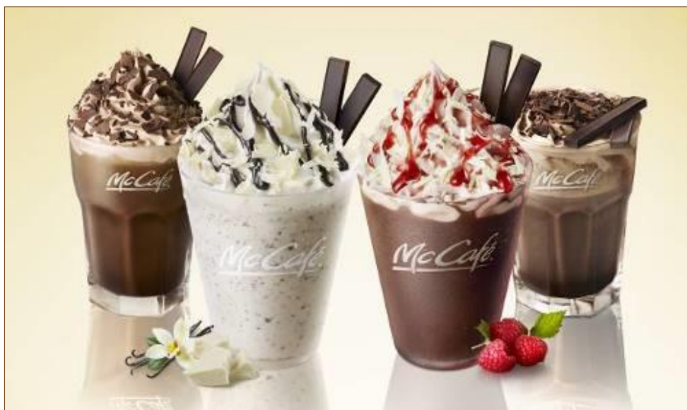
左から「プレミアムアイスチョコレート」、「プレミアムホワイトチョコレートフラッペ」、「プレミアムラズベリーチョコレートフラッペ」、「プレミアムホットチョコレート」 ※画像はイメージです

マクドナルドはこれからも、専任バリスタによる本格カフェコーナー“McCafé by Barista”にて、高品質かつお得感あるカフェメニューの提供と、マクドナルドにある身近なつろぎの場として、居心地のよいカフェ体験をお届けしてまいります。