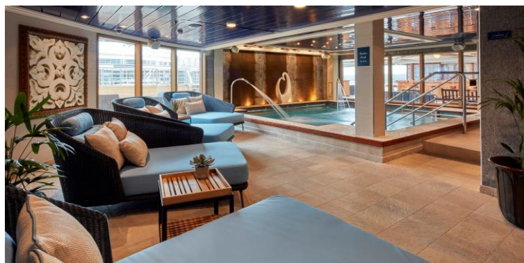
クイーン・エリザベス新設 『マレール ウェルネス&ビューティ』 タラソセラピーの施術ルーム

イギリスのラグジュアリー・クルーズ・ライン、キュナードは、新ホリスティック・スパ・コンセプト『マレール ウェルネス&ビューティ』を発表しました。