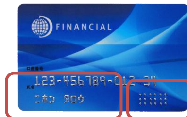
エンボス部に着色(トッパー加工)を施し、見易さを強調

氏名や口座番号などの凹凸記載のエンボス加工はもちろんのこと、TIM※(触覚識別マーク)準拠のエンボス加工にも対応し、バリアフリーに配慮したサービスの提供を可能にしました。