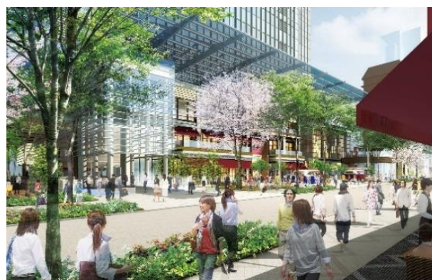
「日本橋室町三井タワー」大屋根を配した広場イメージ