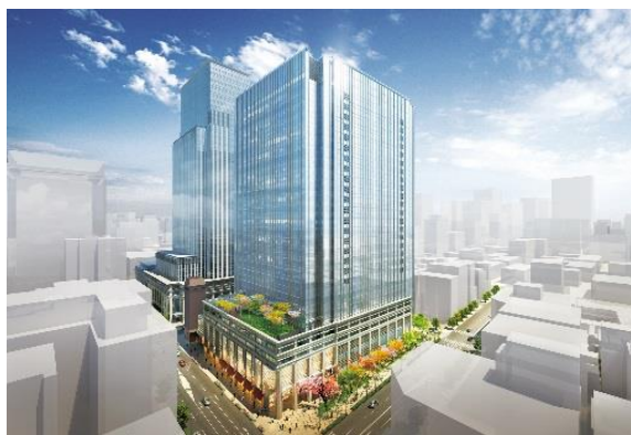
「日本橋室町三井タワー」外観イメージパース

「日本橋室町三井タワー」は、当社が取り組む「日本橋再生計画」において、日本橋エリアの情報発信拠点となる最新の大規模複合ビルです。最先端のオフィス空間、様々な用途に利用できるホール&カンファレンス、日本初となる既存街区を含むエリア供給型のエネルギープラントなどに加え、日本橋に新たな賑わいを創出する商業施設や、豊かな緑あふれる潤いのランドスケープと大屋根を配した広場を備え、日本橋エリアの魅力のさらなる向上を実現します。