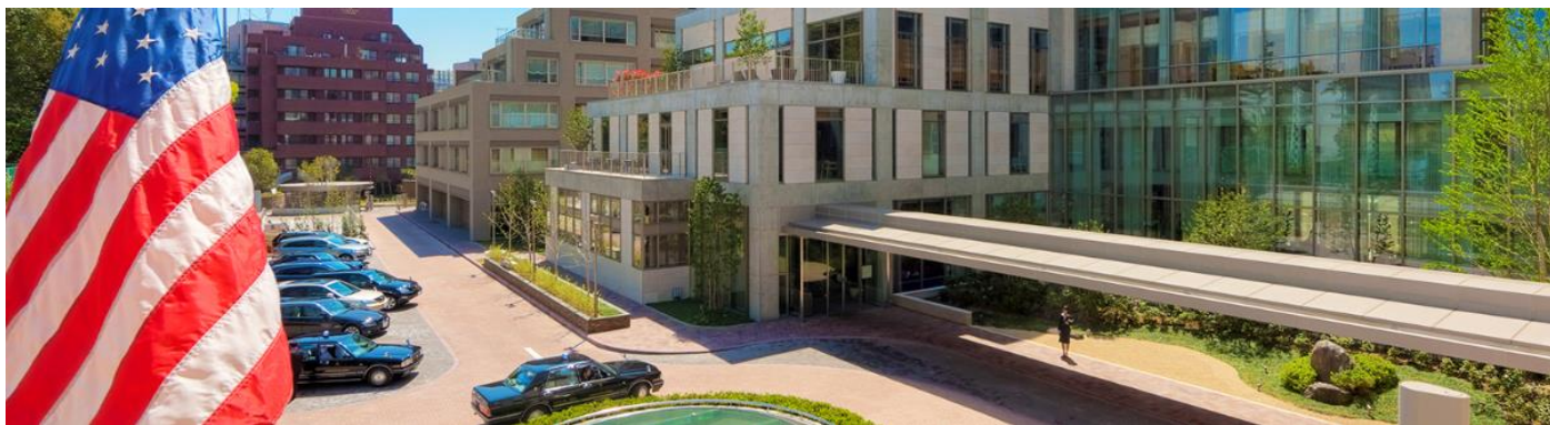
東京アメリカンクラブ メインエントランス(東京都港区)

東京アメリカンクラブは1928年から続く伝統ある格式高い会員制クラブであり、会員に対して文化、ビジネス、レクリエーションなど多様な側面から施設やイベントを提供し、東京において国際的なコミュニティを創出しています。東京都港区麻布台二丁目所在の施設では、5つのレストラン、会議施設、宿泊施設、フィットネスクラブ、スパ、ルーフトッププールなどの施設を備え、2018年にClub Leaders Forumの選出する“Platinum City Clubs of the World top 100”に名を連ねるなど国際的に高い評価を得ており、サテライトクラブの開設は本施設が初となります。