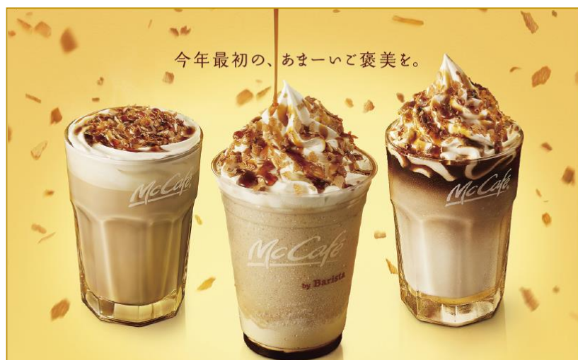
左から「クリームブリュレラテ」「クリームブリュレフラッペ」「アイス クリームブリュレラテ」 ※画像はイメージです

2019年の可能性に期待を膨らませる新年のカフェタイムを「クリームブリュレ」シリーズとお供にゆったりしたひと時をお過ごしください。マクドナルドはこれからも、専任バリスタによる本格カフェコーナー“McCafé by Barista”にて、高品質かつお得感のあるカフェメニューのご提供と、マクドナルドにある身近なつづろぎの場として、居心地のよいカフェ体験をお届けしてまいります。