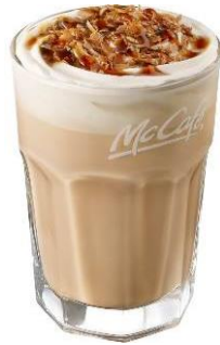
【クリームブリュレラテ】

カラメルソースにほんのり甘いクリームブリュレ風味のホイップクリーム、クリームブリュレシロップを混ぜ合わせたエスプレッソフラッペに、さらにクリームブリュレ風味のホイップクリーム、クラッシュしたシガークッキー、カラメルソースをトッピングしました。薄く焼き上げた香ばしいシガークッキーとふわふわのホイップクリームで、飲むたびに甘みやエスプレッソのコクを感じられ、味の変化をお楽しみいただける、見た目も華やかなフラッペです。