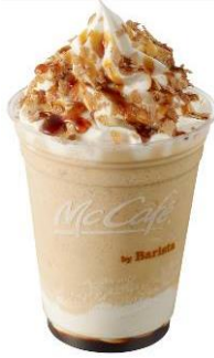
【クリームブリュレフラッペ】

販売時間 - “McCafé by Barista” 営業時間中 (営業時間は店舗によって異なります)