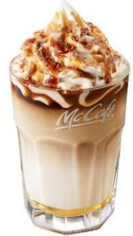
【アイス クリームブリュレラテ】

クリームブリュレシロップにほろ苦いエスプレッソとふわふわにフォームしたミルクを加えました。その上に、ほんのり甘いホイップクリームとクラッシュしたシガークッキー、さらにカラメルソースをトッピングしました。香ばしいシガークッキーのサクサク食感とほんのり甘いホイップクリームのコンビネーションが楽しめるスイーツ感覚のホットラテです。