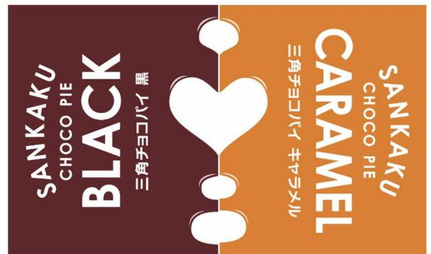
▲ 中央に、♡のマークが！