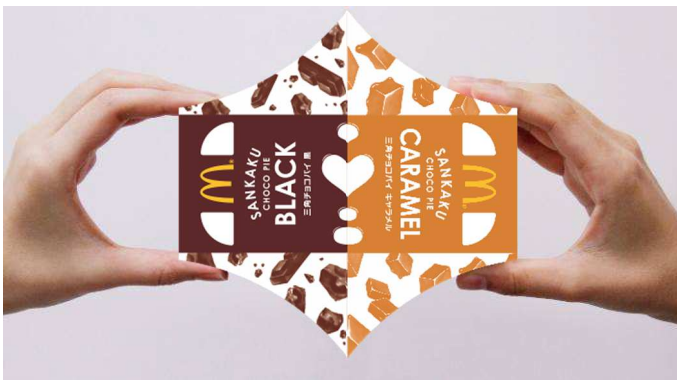
▲ 「三角チョコパイ 黒」と「三角チョコパイ キャラメル」のパッケージを合わせる

「三角チョコパイ 黒」(左)、「三角チョコパイ キャラメル」(右)のパッケージを組み合わせると、真ん中に♡のマークが現れます。