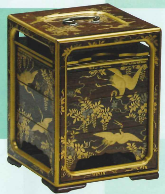
藤鶴蒔絵提重 昭憲皇太后遺品 明治(19世紀) 個人