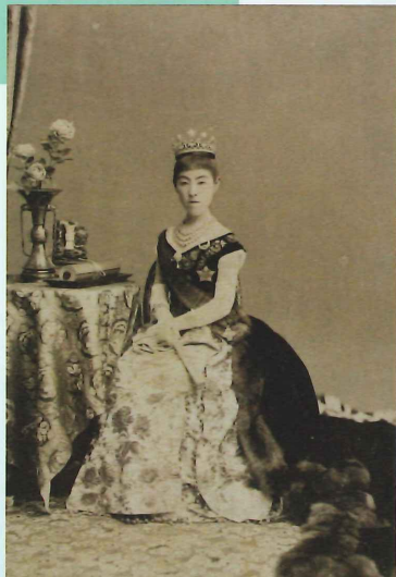
昭憲皇太后 丸木利陽撮影 明治22年(1889) 学習院大学文学部史学科