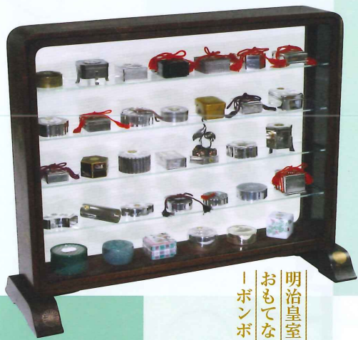
ボンボニエール・飾棚 明治～現代 学習院大学史料館・個人