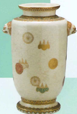
菊桐文花瓶 昭憲皇太后遺品 明治(19～20世紀) 個人