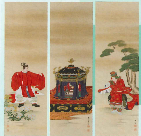
大正天皇即位礼図 原在寛 大正8年(1919) 個人

皇室も例外ではなく、その生活は大きな変革を余儀なくされました。諸外国との外交のために、皇室では洋装を採り入れ、洋食にて外国使臣をもてなします。その舞台は、延遠館、鹿鳴館、そして明治宮殿と移り変わります。そのような西洋文化受容の中でも、ドレスには日本の刺繍を施し、下賜品には日本の伝統工芸品を用いるなど、伝統文化や職人技術の保護育成を重要視していました。 明治150年、そして新時代が幕を開ける今、明治皇室が守り伝えようとした日本の技と美をご覧ください。