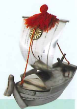
和船形ボンボニエール 学習院大学史料館