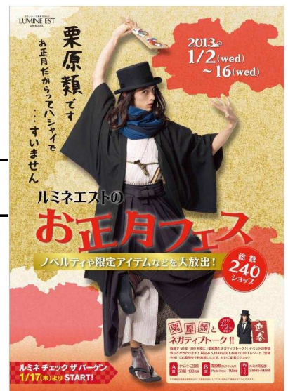
ポスタービジュアル

1/2(水)～1/9(水)の期間、¥1,000 お買い上げ毎に 3 ポイント加算。150 ポイントで、¥5,000 分のお買い物券をプレゼント！