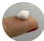
テクスチャー画像