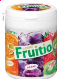
『フルーティオ アソートファミリーボトル』