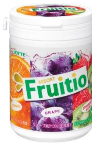
『フルーティオ アソートスリムボトル』