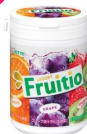
『フルーティオ アソートスリムボトル』