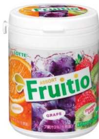
『フルーティオ アソートファミリーボトル』