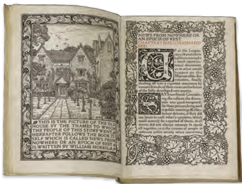
『ユートピア便り』(I期) ウィリアム・モリス 1893年

「本は美しい物であるべき」というモリスの信念に基づいた、芸術としての「本」を是非ご覧ください。