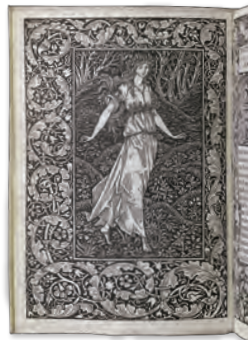
『世界のかなたの森』(II期) ウィリアム・モリス 1894年