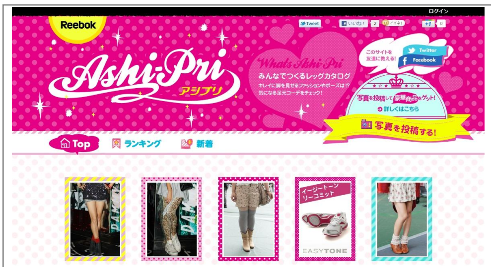
【 Reebok アシプリ トップページ 】

『Reebok アシプリ』は様々な足元のコーディネート写真をFacebookやTwitterのアカウントを使用して投稿できる一般参加型のウェブサイトです。『Reebok アシプリ』の投稿写真にドレスコードはありません。スポーツ、カジュアル、ビジネス、ストリート、パーティーなど、あらゆるシーンでの自分らしいコーディネート写真を募集しています。さらに、投稿写真の中から自分のお気に入りのコーディネートスタイルに投票することもでき、ランキング上位者には履きだけでエクササイズ効果のある「EASYTONE」などの素敵なプレゼントをご用意しています。