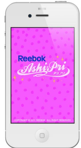
【 iPhone アプリ トップページ 】

9月末にはiPhoneアプリも完成予定です。iPhoneカメラで撮影、デコや加工をして投稿ができる便利なアプリです。