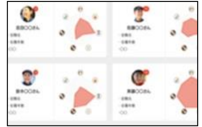
クルーの習熟度を自動 で一元管理