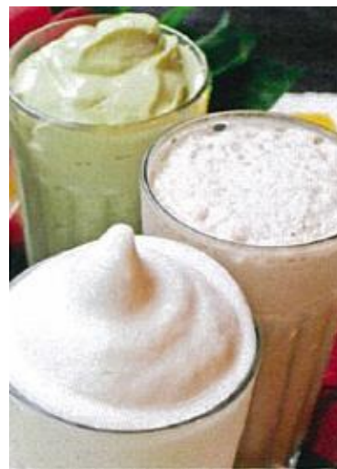
ソイミルク・シェイク 648 円 (フレーバー追加 +216 円)

◆ その他にも、パスタ・サラダ・キッズメニューなどのお食事メニューをご用意しております。