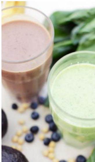
グリーン・ベジ・スムージー 702 円

◆ 野菜やフルーツをミックスしたスムージーや、有機豆乳とてんさい糖を使用したソイミルクシェイクなど。カラダに優しいドリンクメニューを提供します。