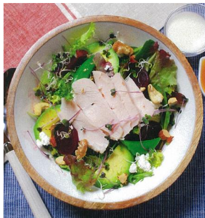
中央)鶏むね肉とミックスリーフのサラダ 843 円