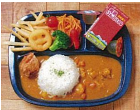
左)キッズ・プレート 681 円

◆ その他にも、パスタ・サラダ・キッズメニューなどのお食事メニューをご用意しております。