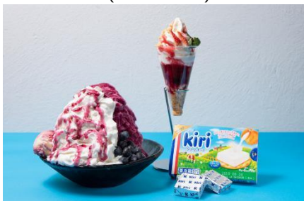
ICE MONSTER (アイス モンスター)