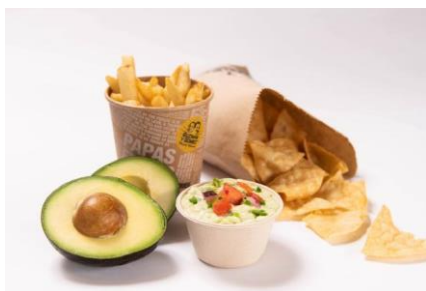
Guzman y Gomez (グズマン イー ゴメス)