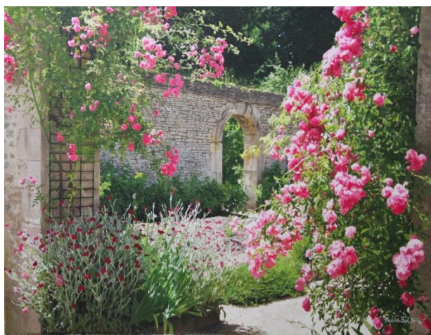
大城真人「初夏の庭」10号