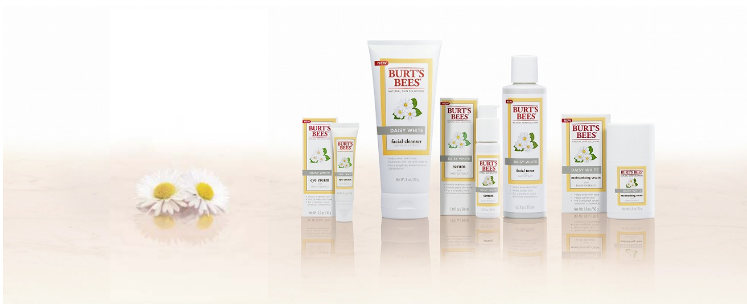
BURT'S BEES デイジー 左から「アイクリーム」「クレンザー」「セラム」「トナー」「クリーム」 販売予定価格 各¥2,100～¥3,990（税込）

この度、“地球に優しく、人に優しい”を信条とするアメリカ生まれのナチュラル・パーソナルケアブランド BURT'S BEES(バーツビーズ)が、アジア女性のために開発したブライトニングライン「デイジー」を発売いたします。