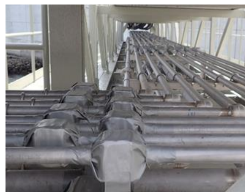
シップリフト(左)およびオートテンションウインチ(右) YUS®2120 シームレス鋼管の敷設状態