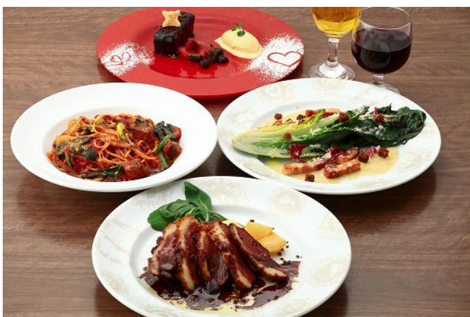
『バレンタインディナーコース』 チョイスの一例 (お酒はコースに含まれません)

シャルlotte チョコレート ファクトリーで、よりスイートなバレンタインデーをお過ごしください。