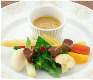
「砂肝のコンフィと温野菜のサラダ 特製ヴァーニャカウダソース」