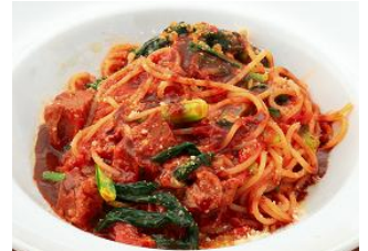
「ビーフラーと小松菜のスパゲティー チョコグレービーソース」