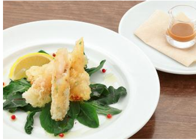
「ライスネットで巻いたエビのフリット チョコチリディップソース」