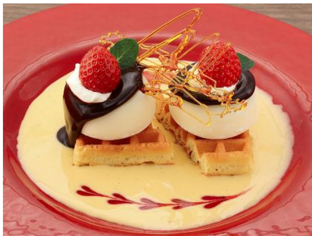
『バレンタイン“とろーり”ペア雪見』

シャルlotte チョコレート ファクトリーでは、ロッテのチョコレートカフェならではのオリジナルデザート『バレンタイン“とろーり”ペア雪見』および『バレンタインディナーコース』を、バレンタインシーズン限定で販売します。