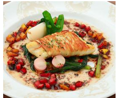
「築地直送じゃが芋の紐で巻いた 真鯛のポアレ ソースピカンテ」