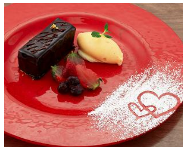
「チョコレートと ヨーグルトのムース 濃厚なヴァニラ アイスクリーム添え」

プラス300円でデザートを 『バレンタイン“とろーり” ペア雪見』に変更できます