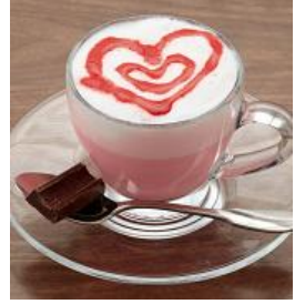
『HOTいちごミルク in Ghana Chocolate』