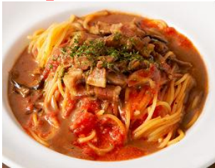
「ベーコンときのこの チョコマトソース」