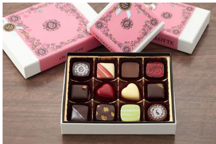
『ハートコレクション12』 ¥2,580