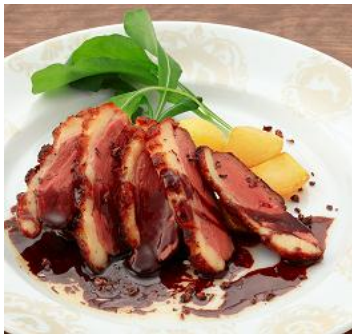
「フランス産マグレ鴨のロースト レッドヴィネガーとガーナブラックのソース」