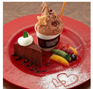
「クラシックショコラ 季節のフルーツと ガーナショコラ ジェラート」