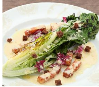
「ロメインレタスの焼きシーザーサラダ ガーナホワイトとアンチョビのドレッシング」