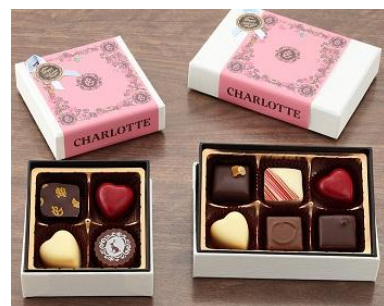
左から 『ハートコレクション4』 『ハートコレクション6』