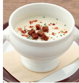
「白いんげん豆のポタージュ カカオとベーコンのクルトン」