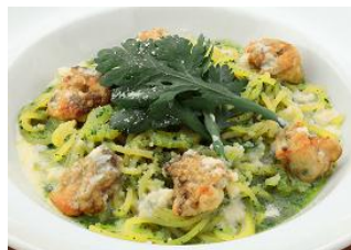
「無菌牡蠣と春菊のピューレ ホワイトチョコとパルメザンソース」