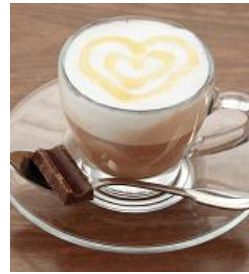
『HOTバナナチョコミルク in Ghana Chocolate』