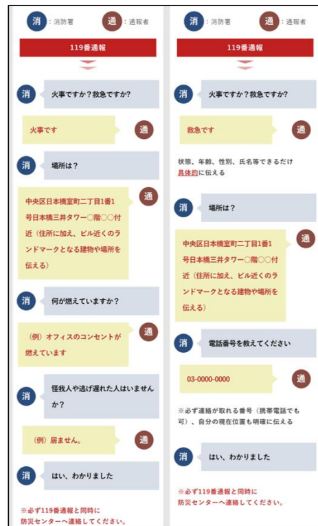
『31 防災 Web』 防災マニュアルイメージ (左:① 地震発生時について 右:② 通報について)