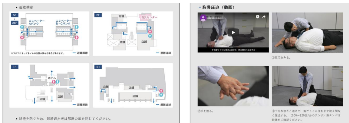
『31 防災 Web』 防災マニュアルイメージ (左:④ 避難について 右:⑤ 救護について)