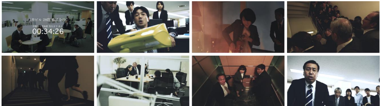
『31 防災 Web』 動画イメージ

本動画では、首都直下地震発生時にオフィス内で起こりうる消火活動や救護、避難などにおいて備えておくべきポイントをまとめています。さらに各ポイントを解説し、日頃の訓練や自助・共助の大切さを学ぶことができます。